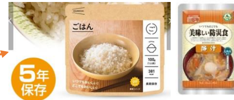
非常食や非常食になる県産品・その他商品など