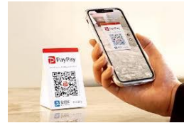
支払いはPAYPAY 及び料金箱