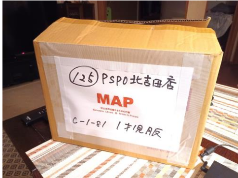
配置場所:〇〇〇会社倉庫 内容物:一歳児洋服