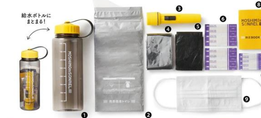
携帯・クルマに 9点 SET