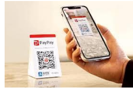
支払いはPAYPAY 及び料金箱