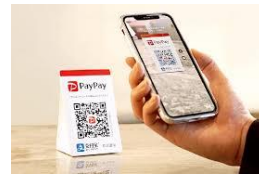
支払いはPAYPAY 及び料金箱